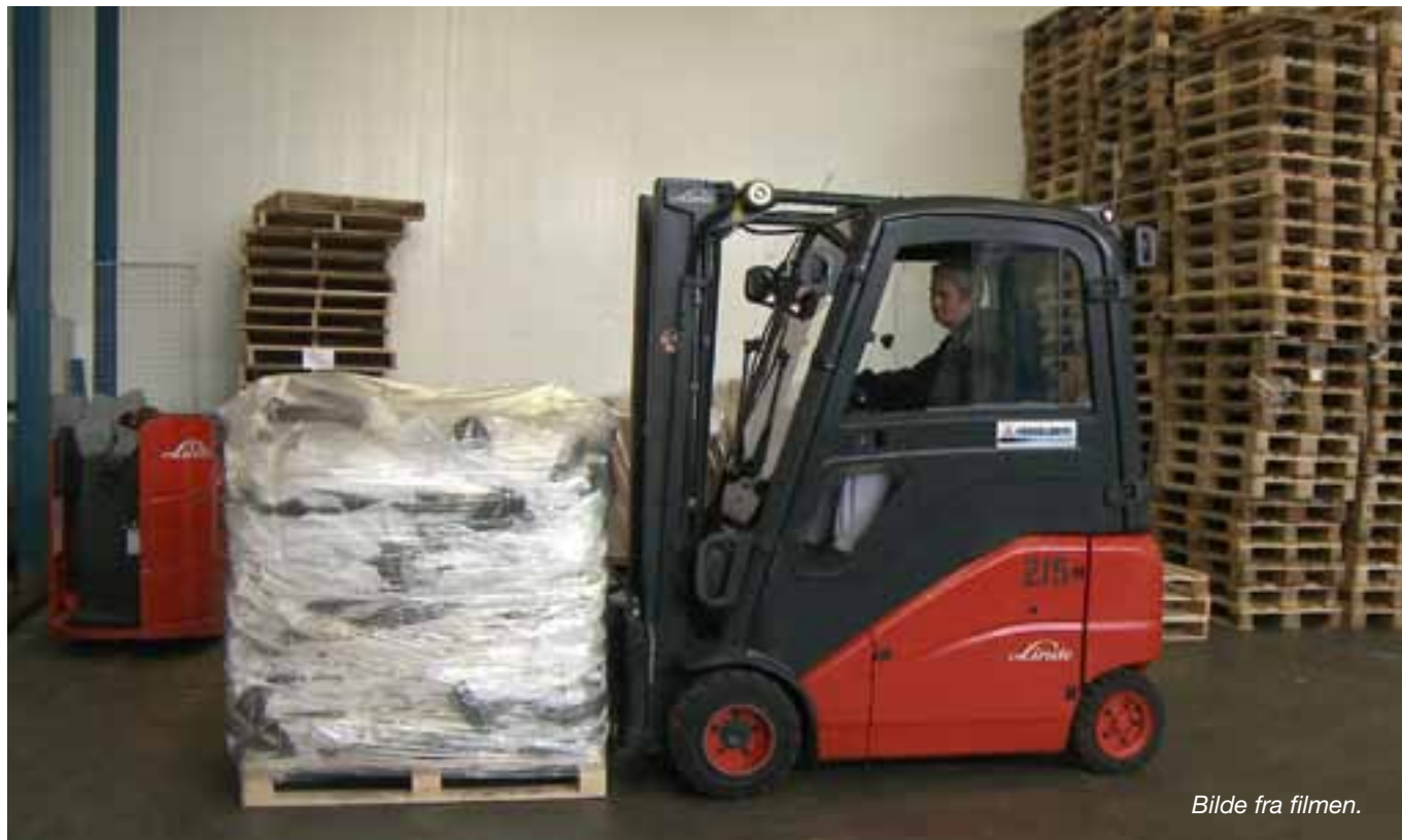
Bilde fra filmen.

Filmen er godt mottatt i markedet. Den følger opplæringsplanene og er et pedagogisk hjelpemiddel til truckførerboken.